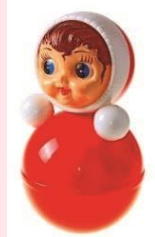
Рис. Игрушки для развития двигательной активности.