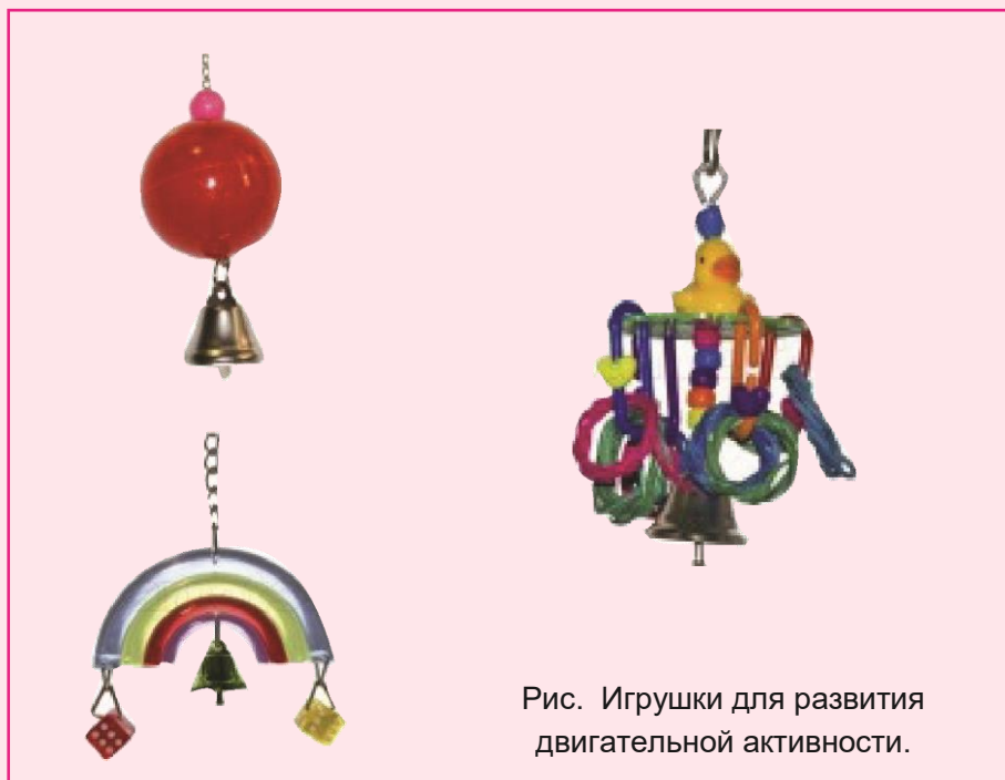
Рис. Игрушки для развития двигательной активности.