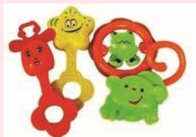
Рис. Геометрические погремушки