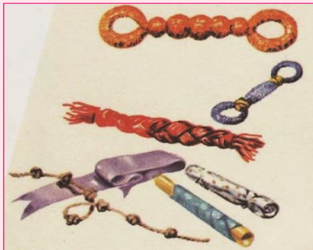
Рис. Предметы вкладыши для развития хватательных движений